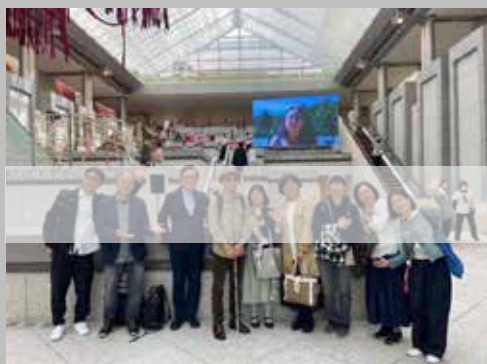
↑全盲のアートナビゲーターN氏と美術館にてSAV