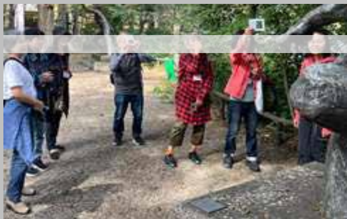
↑彫刻でVTS_デッサンスケールでスマホ写真の画角設定をしてみたWS