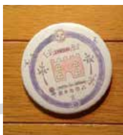
三鷹市井の頭保育園 シンボルマークデザイン