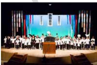
コンサートミュージカル動物会議 (三鷹市公会堂さんさん館)