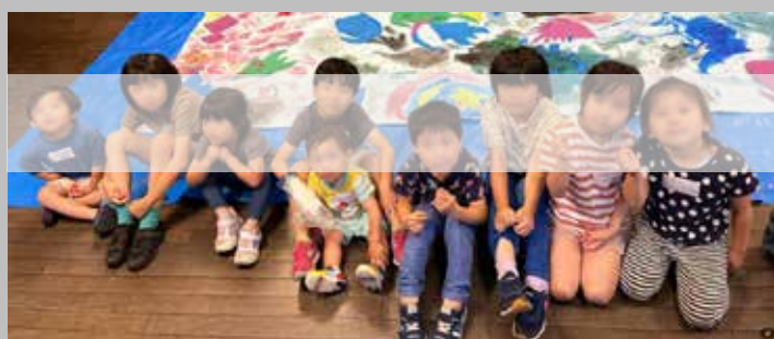
↑児童とオペラ歌手の生歌を聴いて、感じたままにお絵描きをしたWS

※三鷹ネットワーク大学 まちづくり研究所 研究員として提案論文採択される 112頁から134頁参照_右記QR上段より→