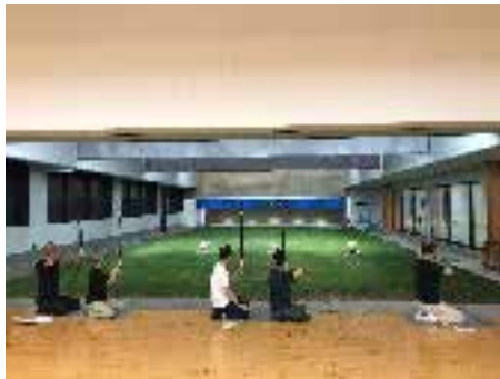
三鷹市 SUBARU 総合 スポーツセンター 弓道場にての練習風景