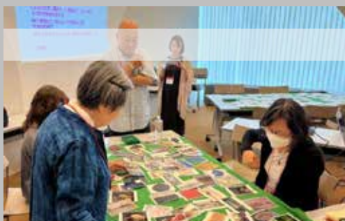
↑アートカードゲームでVTSのアイスブレイク