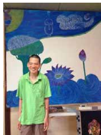
井の頭公園100年祭 ライブペイント・テーマ「ひらく」