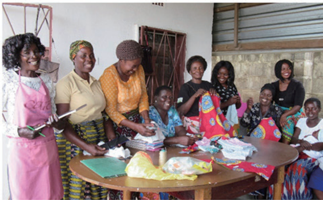
チテンゲ小物を作製しているコミュニティボランティアさんたち

ヘルスセンターから離れた場所で乳幼児健診を行ったり、コレラが流行した時には拡声器を持って知識普及のために村をねり歩いたり、自分たちの住む地域の健康度を上げるために日々活動をしています。そんな彼らが、自分たちのボランティアの活動費用を捻出するために、チテンゲと呼ばれるアフリカのカラフルな布を使った小物作りを始めました。私たち NPO は、その IGA (Income-Generating Activity : 利益獲得活動) をバックアップするために、それらチテンゲ小物を購入し、日本で販売しています。発展途上国と言われる国を支援している団体は数多くありますが、現地のボランティアさんが作った手作りの物を日本で販売するという団体は珍しいのではないかと考えています。ほとんどの製品は、ひと針ひと針手縫いで作られていて、縫製がきちんとしていなかったり、形もまばらだったりしますが、それらをひっくるめてザンビアらしさとして受け取っていただければと思っています。「多少のこと(多くのこと?)