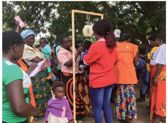
コミュニティボランティアさんが実施している乳幼児健診の様子

は気にしない」「物はなくても楽しく生きる」「遅刻しても知り合いとの挨拶優先」「何よりも家族の時間が大切」など、人とのつながりに価値をおき、いつも笑顔でおおらかなザンビア人に学ぶべきところは沢山あると思っています。私たち NPO はそんなザンビアと日本を繋げたいという想いを胸に、無理なく、持続可能な支援の形を模索しながら活動しています。NPO が立ち上がってまだ3年目の若い団体ですが、三鷹市を拠点に笑顔を広げたいと思っています。