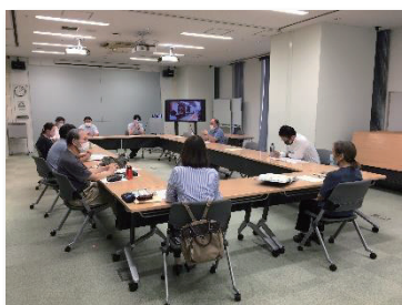
◎まちづくり研究員事業

■三鷹ネットワーク大学の取り組み事例紹介……詳しくはHPをご覧ください。 https://www.mitaka-univ.org/