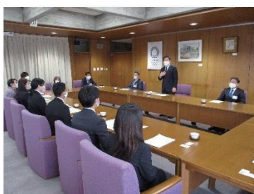
◎学生によるミタカ・ミライ研究アワード