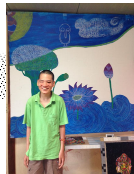
井の頭公園100年祭 ライブペイント・テーマ「ひらく」