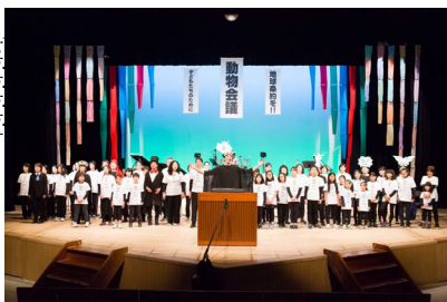
コンサートミュージカル動物会議 (三鷹市公会堂さんさん館)