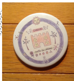
三鷹市井の頭保育園 シンボルマークデザイン