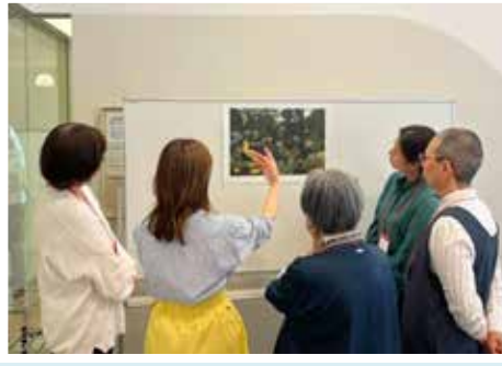
(1)アートコミュニケーター演習中の状況