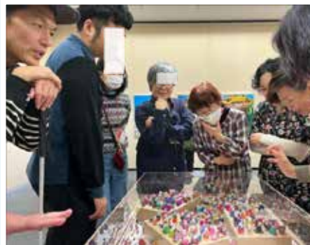
(3)白杖のIさんと 吉祥寺美術館にて