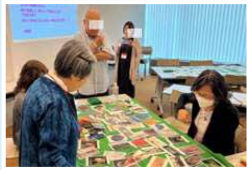
(2)アートカードで講座の最初にアイスブレイク