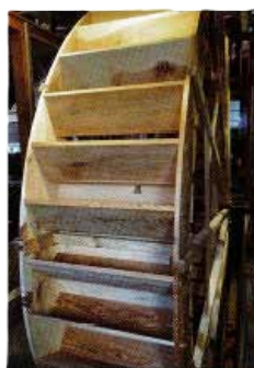
絵図：都指定有形民俗文化財 武蔵野(野川流域)の水車経営農家