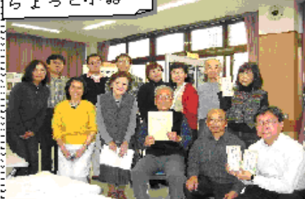
フォーラムの準備で前日に集まったみなさん