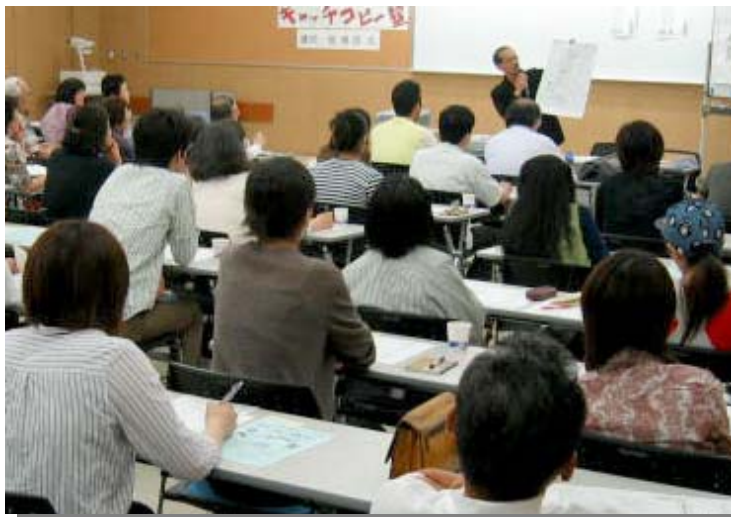
前回のキャッチコピー塾の様子