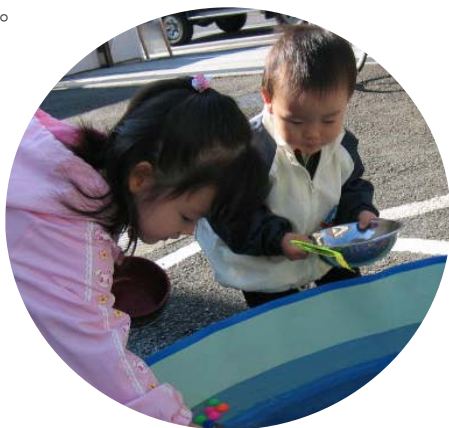
主催:第5回みたか市民活動・NPOフォーラム実行委員会、三鷹市

今年で第5回を迎えたこのイベントは、ジャンルを問わない36の団体が参加し、パネル展示などによる情報交換を行います。