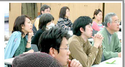
↑キャッチコピー塾の様子