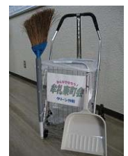
スーパーお掃除 カート