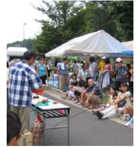
たくさんの住民の参加 で大盛況！

町会のみでなく、地域内の企業や施設などに協力を依頼。納涼まつりでの交流を通して、大沢の街づくりへの関心、参加意識の向上や街の活性化と安全安心の促進を図った。1,200名の参加者があり、地域の交流、ふるさと作りの効果は大きかった。