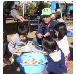
おじいちゃんたちが作っ てくれた折り紙金魚で孫 たちが釣りを楽しむ