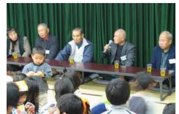
お年寄りのお話に耳を傾ける子どもたち

子ども会、敬老会などと一緒に企画し、75歳以上の町会員と孫、ひ孫世代との交流、相互の親睦と連携を図った。 ①お年寄りの子ども時代の生活の様子、空襲体験などを話してもらおう。②けん玉、ベーゴマなど昔の遊び道具を製作する。③子ども達が育てた地元野菜と一緒にすいとんを作り、会食する。④新川ばやしやダンスなど演芸会を楽しむことを軸に開催。子どもとお年寄りの交流が楽しくでき、好評であった。