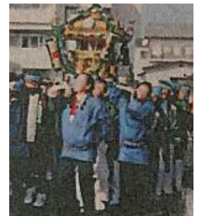
臨場感溢れる神輿にお年寄りたちも大喜び

地域にある高齢者施設の「老人保健施設はなかいどう」及び「東京弘済園」を訪問し、神輿を披露。お祭りの雰囲気を感じてもらうことによって、高齢者に活力を与え、地域とのふれあいを密接にし、高齢者に対する思いやりの精神を啓発することが目的。お年寄りも多数参加し、盛大に行われた。3年前からのこの行事を実施しており、今年DVD化。今後、速やかに周知し、子ども神輿などで参加者をふやしていきたい。また、他の町会で企画があれば参加し活動の幅を広げたい。