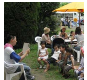
絵本の読み聞かせに 子どもたちも夢中

今後、地域の団体の発表の場、地域の情報センター、若い人たちの活躍の場を目指し、地域のネットワーク作りのお役に立てることを願っている。