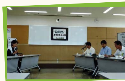
昨年7月の選考委員会