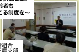
全日本年金者組合 東京都本部三鷹支部