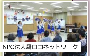
NPO法人鷹ロコネットワーク