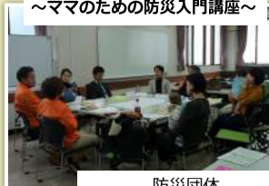
防災団体 やろうよ！こどもぼうさい