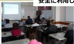
NPO法人シニアSOHO普及サロン・三鷹情報セキュリティ研究会