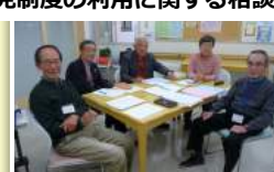
生きがいクラブ武蔵野 × NPO法人多摩東成年後見の会