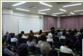
おねえちゃん舎/演劇塾RanRan ×江戸小唄笑い広げ鯛