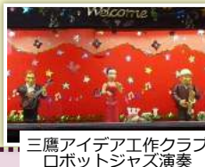
三鷹アイデア工作クラブ ロボットジャズ演奏