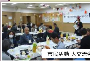
市民活動 大交流会