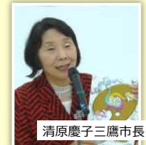
清原慶子三鷹市長