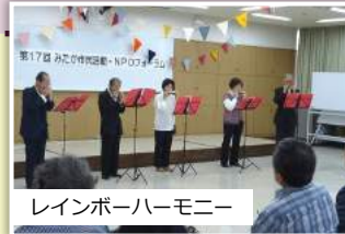
レインボーハーモニー