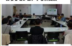
NPO法人 みたか市民協同発電