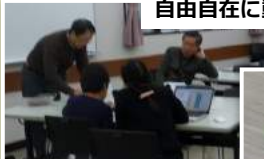
NPO法人シニアSOHO普及サロン・三鷹プログラミング教育ワーキンググループ