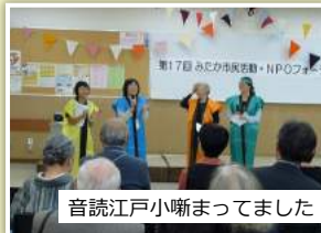
音読江戸小唄まわりました