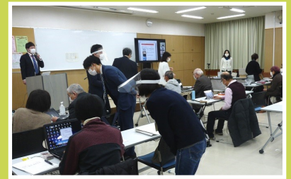
連雀地域の開催の様子