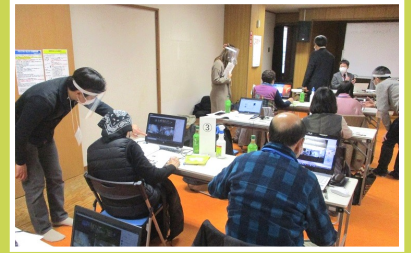
井口地域の開催の様子

今回の受講生のご要望に応じて、さらに実践的な内容のフォロー講座も2,3月に予定しています。