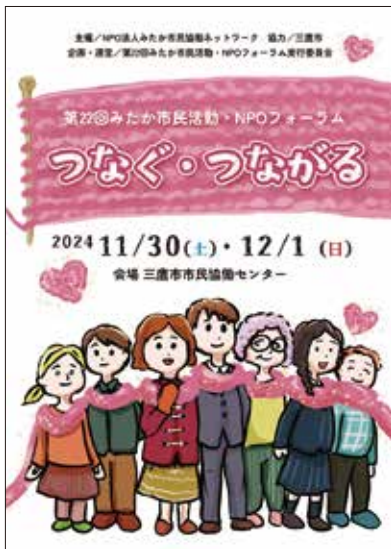
第22回みたか市民活動・NPOフォーラムパンフレット