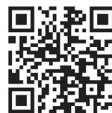
第23回みたか まち活フォーラム